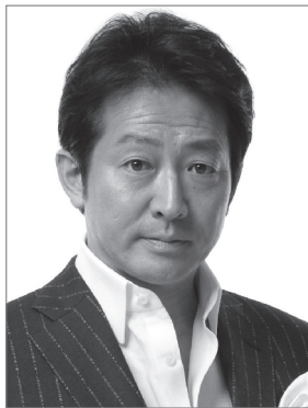
ご案内 辰巳 琢郎 Navigator Takuro TATSUMI

豊かな音楽性を礎に国内外の主要オーケストラと数多く共演を重ねている。最近では「ディズニー・オン・クラシック」の客演指揮者として三度の全国ツアーを成功に導いた他、日本フィルハーモニー交響楽団横浜定期や九州公演ツアーに客演し、好評を得た。2024年には洗足学園創立100周年記念公演祝祭音楽劇『MATEKI』の指揮と音楽監修を担当。オペラの分野にもその活動の場を広げている。